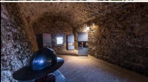
▲ Le Bastion de l'Étendard ▼ L'Escalier du Roy D'Aragon