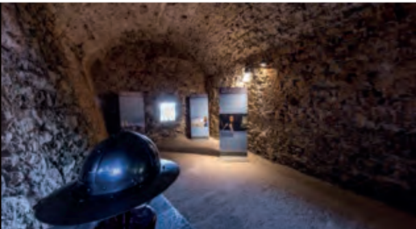
▲ Le Bastion de l'Étendard ▼ L'Escalier du Roy D'Aragon