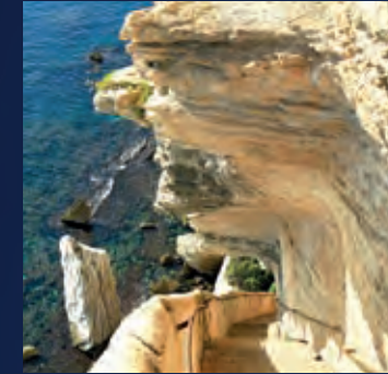
Bastion de l'Étendard & Escalier du Roy d'Aragon